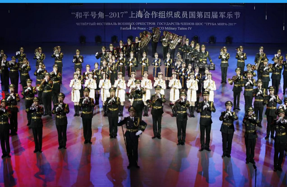
El 26 de agosto de 2017, la banda militar del Ejército Popular de Liberación chino participó en el “IV Festival de la Música Militar de los Estados Miembros de la Organización de Cooperación de Shanghai”.