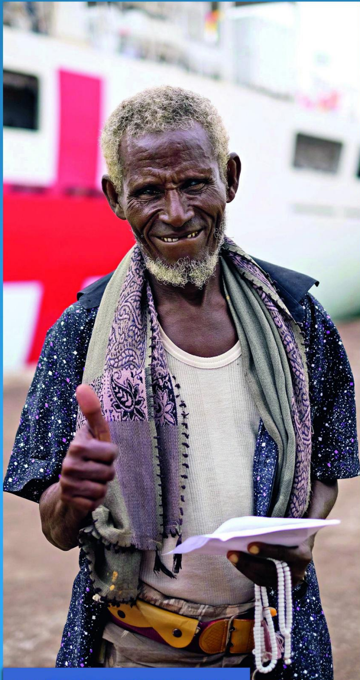
El servicio sincero de los médicos del ejército chino conmueve profundamente a los habitantes de Yibuti.