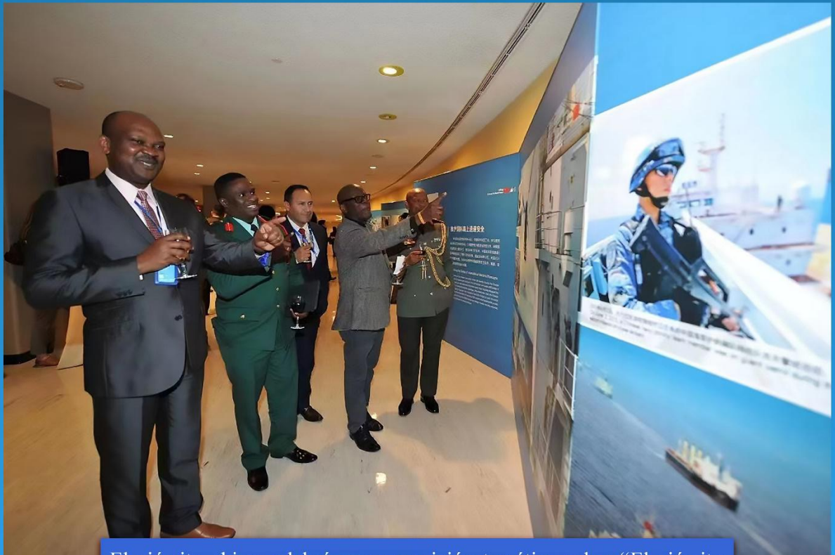
El ejército chino celebró una exposición temática sobre “El ejército chino que defiende la paz mundial” en la sede de las Naciones Unidas y la Unión Africana.