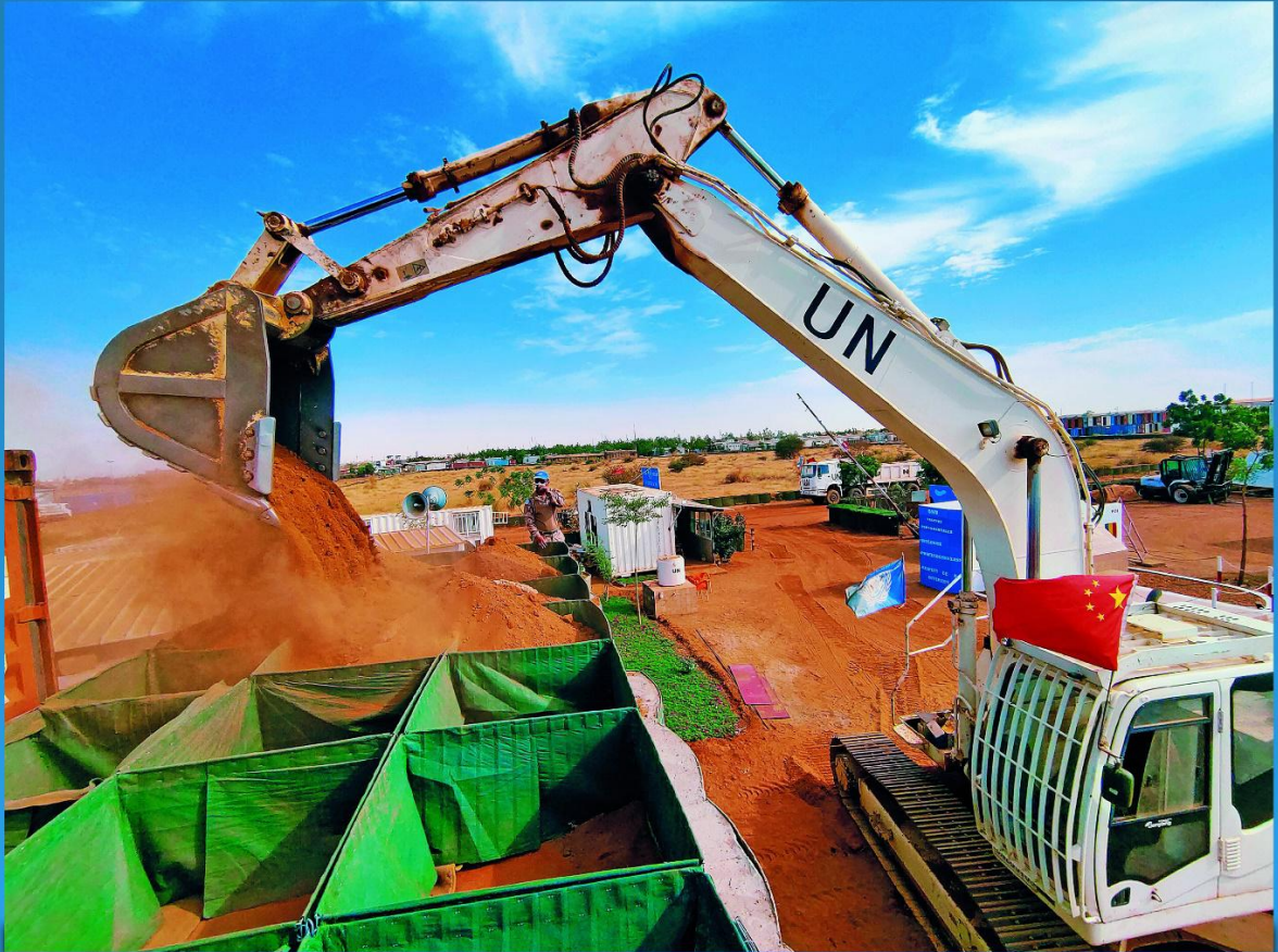
En diciembre de 2021, el destacamento chino de ingenieros para el mantenimiento de la paz en Malí estaba ayudando en renovar el campamento del contingente policial senegalés.