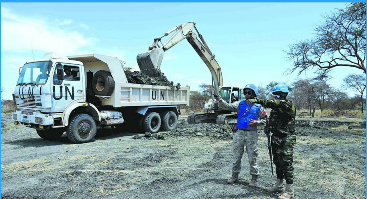
En abril de 2023, el destacamento chino de ingenieros para el mantenimiento de la paz en Sudán del Sur culminó la tarea de construcción de la línea de suministro “Ajakwak-Abyei”.