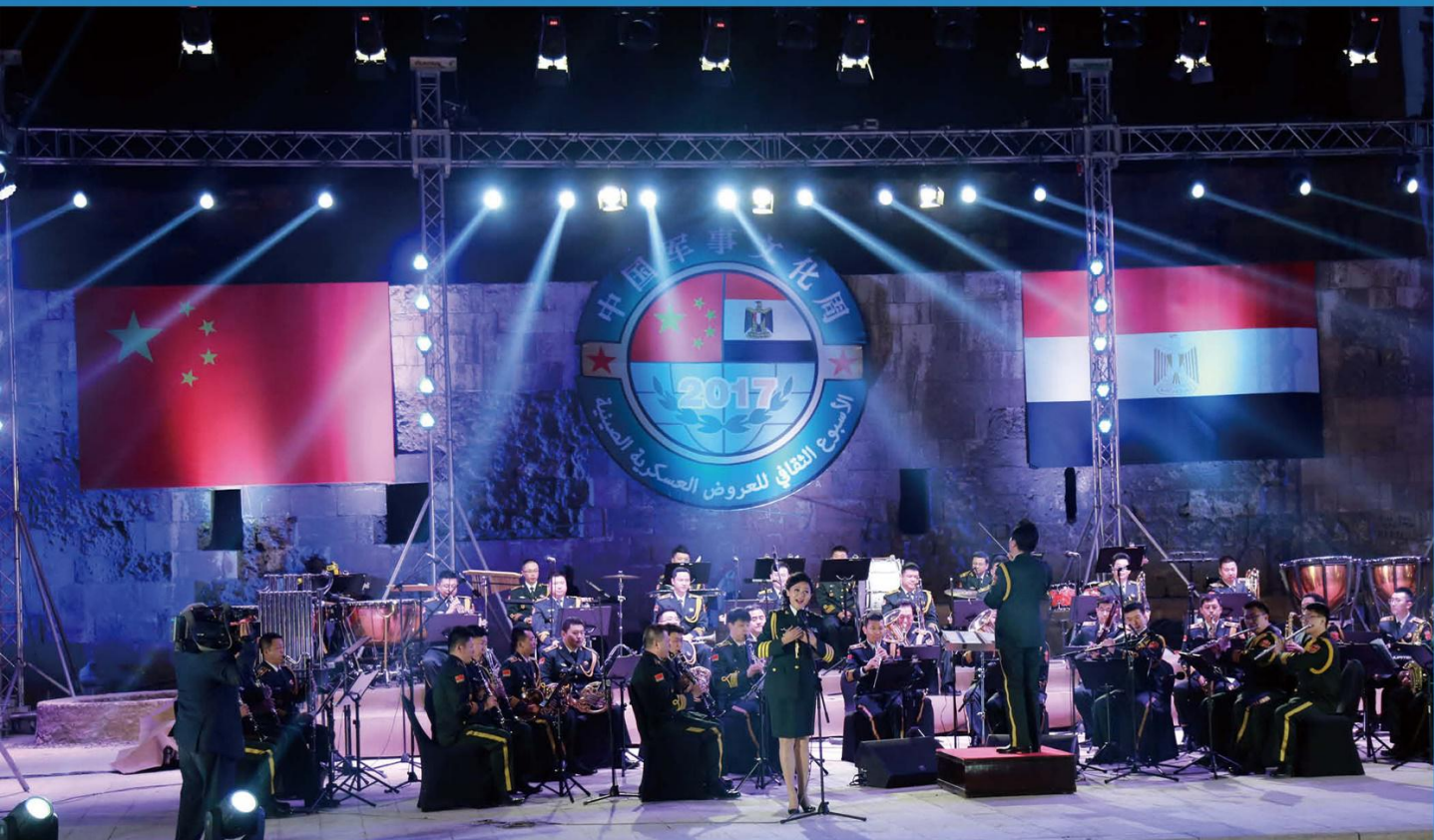
En marzo de 2017 se inauguró la Semana de Cultura Militar China en Egipto.